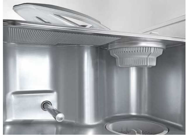
Zij-aanzicht van het interieur van de tank